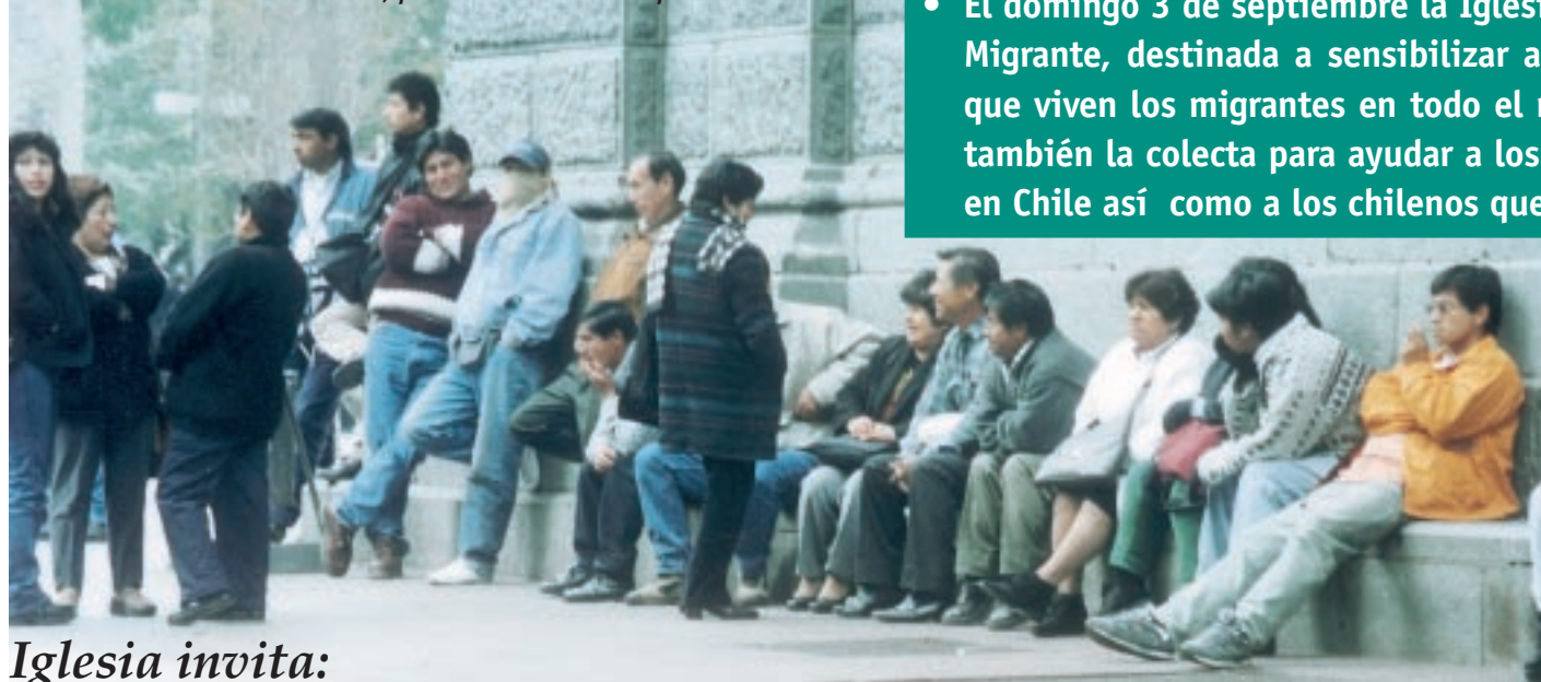
En Catedral con Plaza de Armas, punto de encuentro de peruanos.

La Procesión de la Virgen del Carmen es una de las celebraciones más antiguas de la Iglesia de Santiago. Sus orígenes se remontan al siglo XVII, época en que cada 16 de julio se realizaba una procesión desde la Alameda hasta la Plaza de Armas. ▶▶