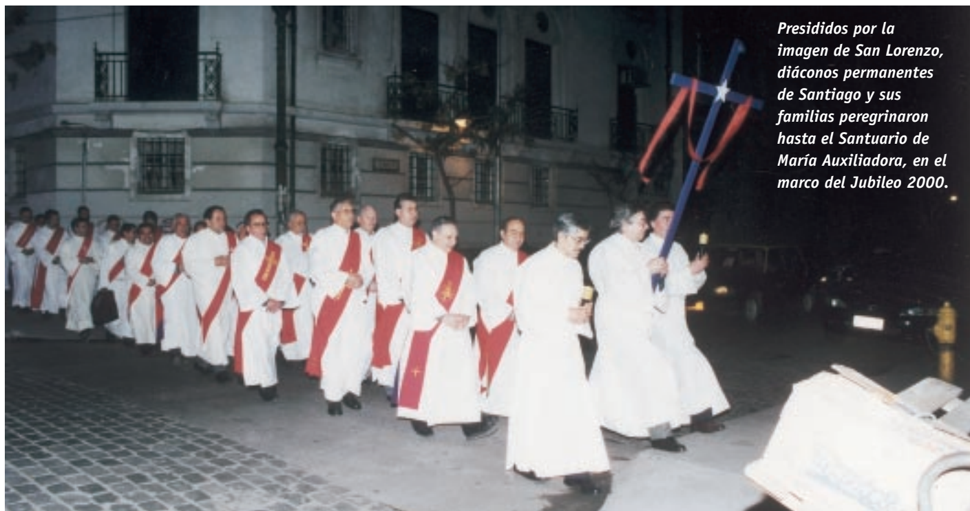
Presididos por la imagen de San Lorenzo, diáconos permanentes de Santiago y sus familias peregrinaron hasta el Santuario de María Auxiliadora, en el marco del Jubileo 2000.

En esta peregrinación participaron los diez nuevos diáconos permanentes ordenados el 12 de agosto pasado, cuya promoción tiene un especial significado para la Iglesia de Santiago, ya