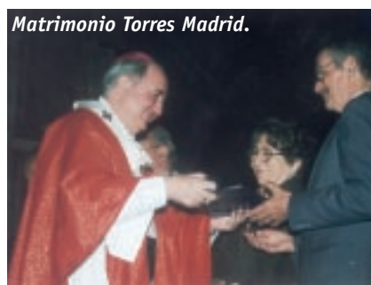
Matrimonio Torres Madrid.