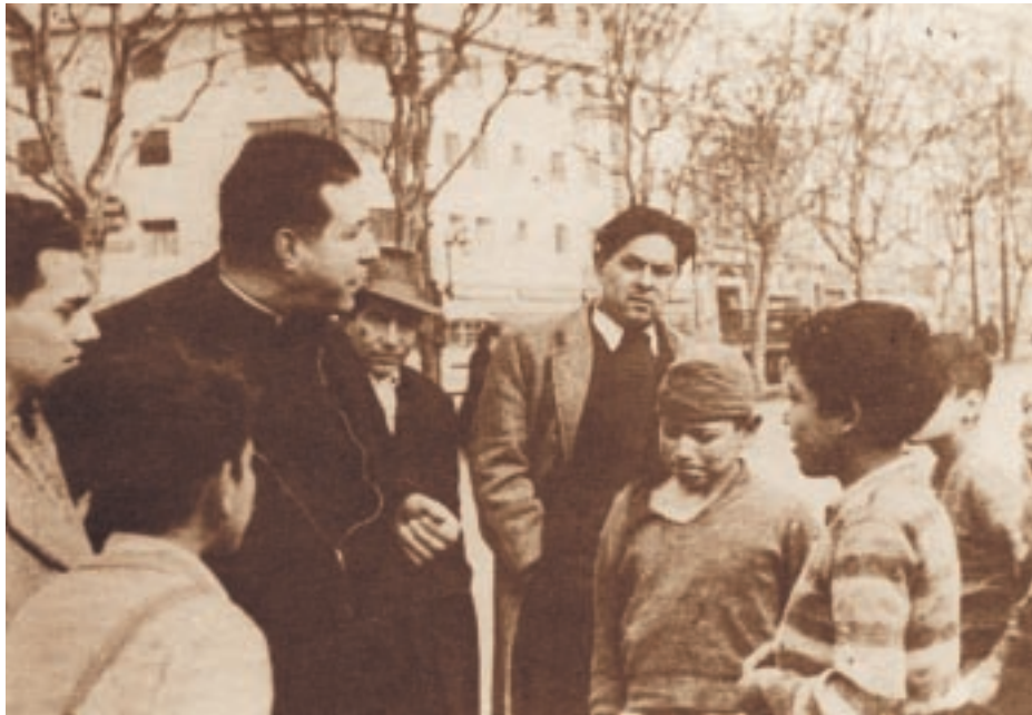
«Compartir algo que aprecie con quien lo necesita», es una de las sugerencias del «Decálogo de la Solidaridad», destinado a hacer realidad el espíritu de solidaridad del Padre Hurtado.

D urante el mes de agosto el espíritu de solidaridad de los chilenos se fortalecerá, en homenaje al Padre Alberto Hurtado. Durante 30 días en todo el país se realizarán diversas actividades destinadas a reflexionar y poner en práctica nuestra solidaridad con los más necesitados.