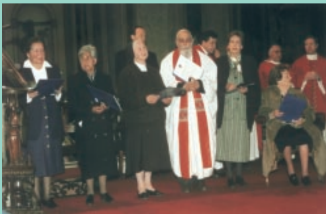
Un grupo de las personas condecoradas.